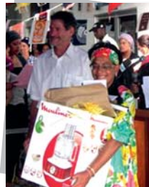
La gagnante du concours Pain d'Épices